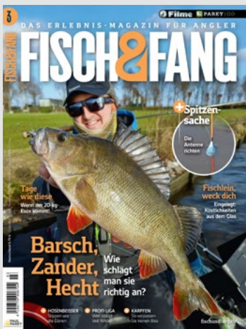
Titel: Steffen Schulz Foto: Fette Barschbeute