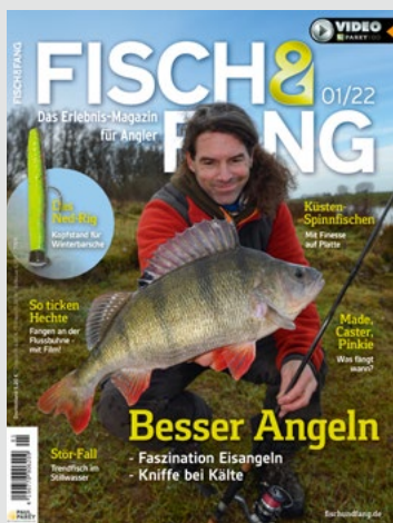
Titel: Dicker Winterbarsch