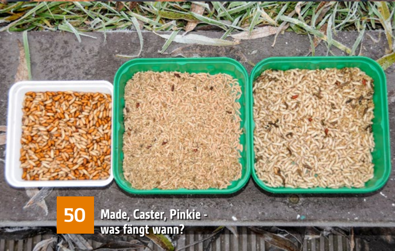
50 Made, Caster, Pinkie - was fängt wann?