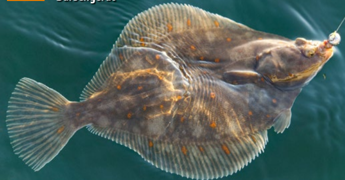
60 Platte mit Barschgerät