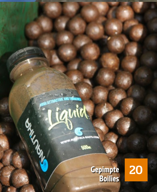
Gepimpte Boilies 20