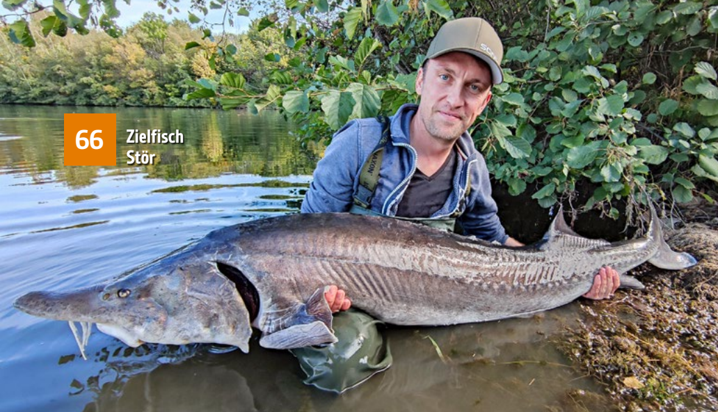
66 Zielfisch Stör