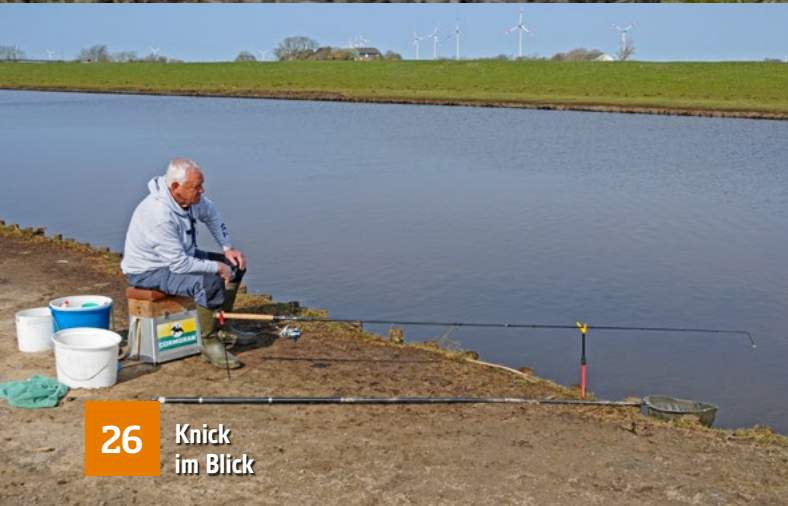
26 Knick im Blick