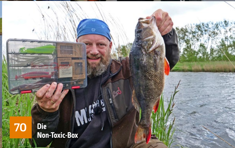
70 Die Non-Toxic-Box