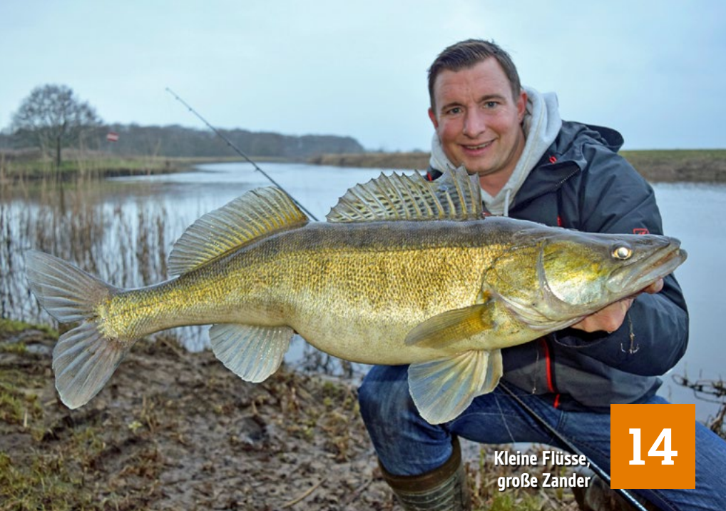
Kleine Flüsse, große Zander