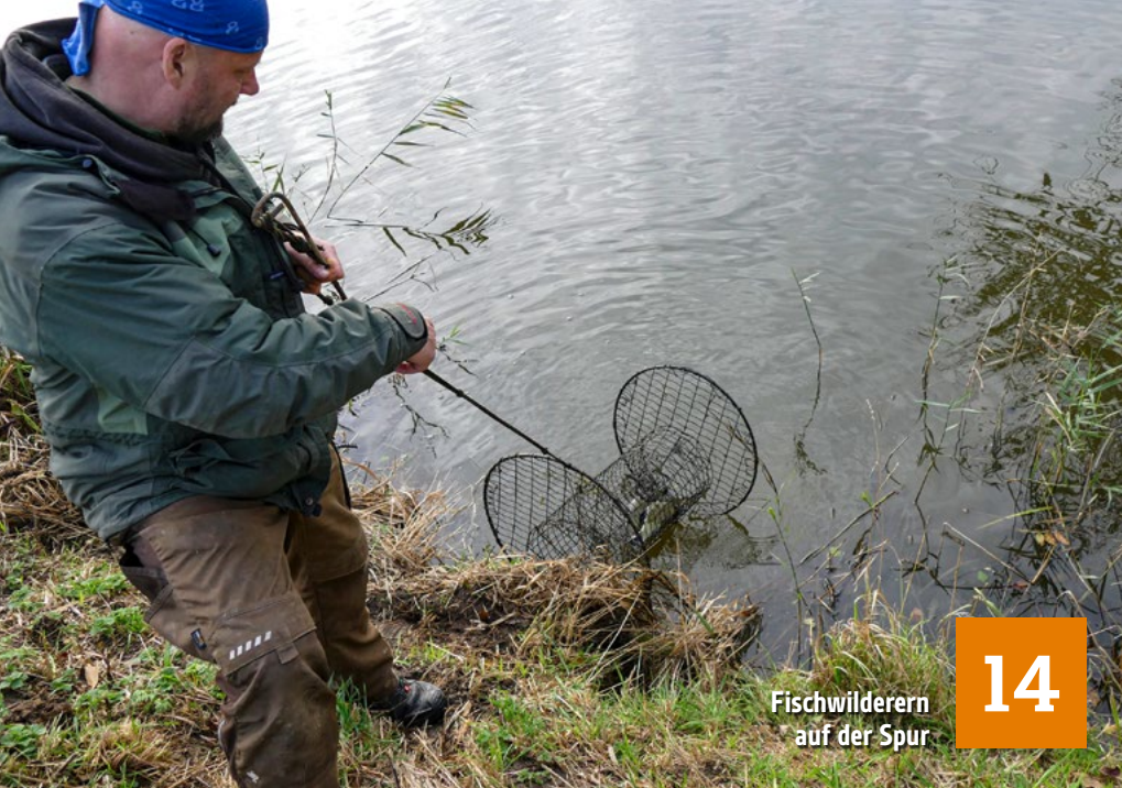
Fischwilderern auf der Spur