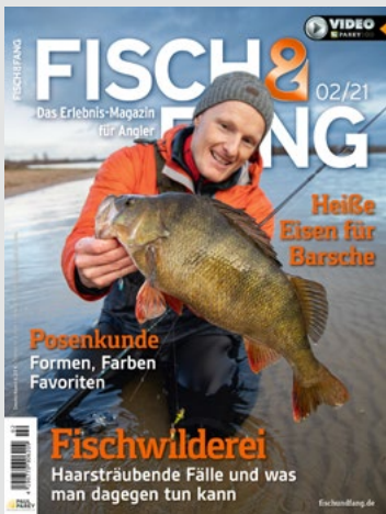
Titel: 50-Plus-Barsch