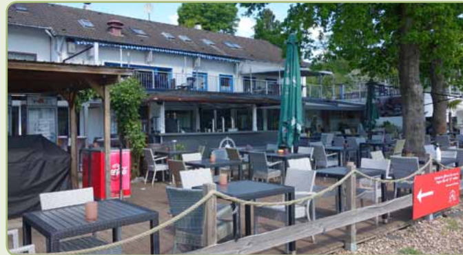
Schöne Terrasse des Restaurants See Bar mit Blick auf dem See

Im Außenbereich gibt es weitere Getränke- und Imbiss-Stände.