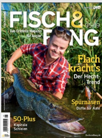
Titel: Hecht im Flachen